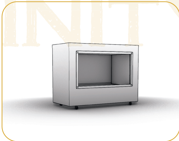
La Esencia | Módulo básico

Módulo compacto formado por contenedores reducidos y estructuras plegables que se adaptan a cualquier tipo de sala con puertas de 1,20x2,10 m.